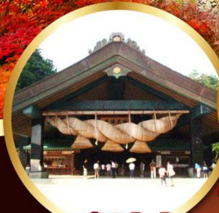
ศาลเจ้าอิชิโมะ-โทเซะ