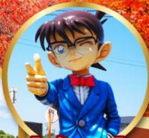
โคนันทาวน์