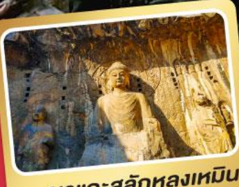
ผาแกะสลักหลงเหมิน