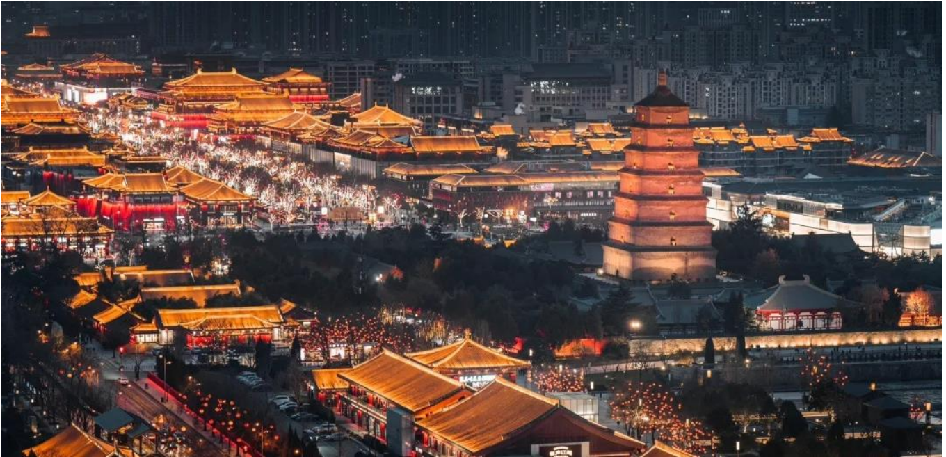
ค่ำ รับประทานอาหารค่ำ ณ ภัตตาคาร (มื้อที่ 12)

सानซี ตั้งอยู่ในหุบเขาที่มีแม่น้ำเว่ยไหลผ่าน มีประวัติศาสตร์ยาวนานกว่า 3,000 ปี ได้ถูกสถาปนาเป็นราชธานีในนาม “นครฉางอาน” เคยเป็นนครหลวงในสมัยต่างๆ รวมทั้งสิ้น 13 ราชวงศ์ ซื่ออานได้เป็นศูนย์กลางการติดต่อทางเศรษฐกิจและวัฒนธรรมระหว่างจีนกับประเทศต่างๆ ทั่วโลก เป็นจุดเริ่มต้นของเส้นทางสายไหมอันเลื่องชื่อ มีโบราณสถานโบราณวัตถุเก่าแก่อันล้ำค่าและเป็นแหล่งท่องเที่ยวที่สำคัญของจีน นำท่านเข้าชม ถนนคนเดินต้าถิง แหล่งท่องเที่ยวสายไหม เสมือนถนนสายวัฒนธรรม ที่จะประดับสีเหลืองทองยามค่ำคืน ที่ซึ่งเหล่าวัยรุ่นจะมาสวมชุดฮั่นฝูกันเต็มทั้งพื้นที่ตลอดทั้งคืน นอกจากนั้นยังมีร้านค้าเครื่องประดับ ของกินของใช้ และกิจกรรมอีกมากมายให้ท่านได้สัมผัสกันอย่างเต็มอิ่ม