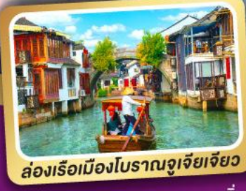
ล่องเรือเมืองโบราณซูเจียเจียว