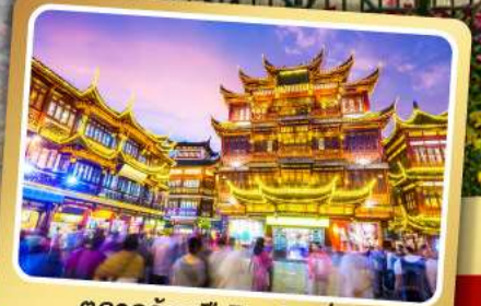
ตลาดร้อยปีฉงหวงเหมียว