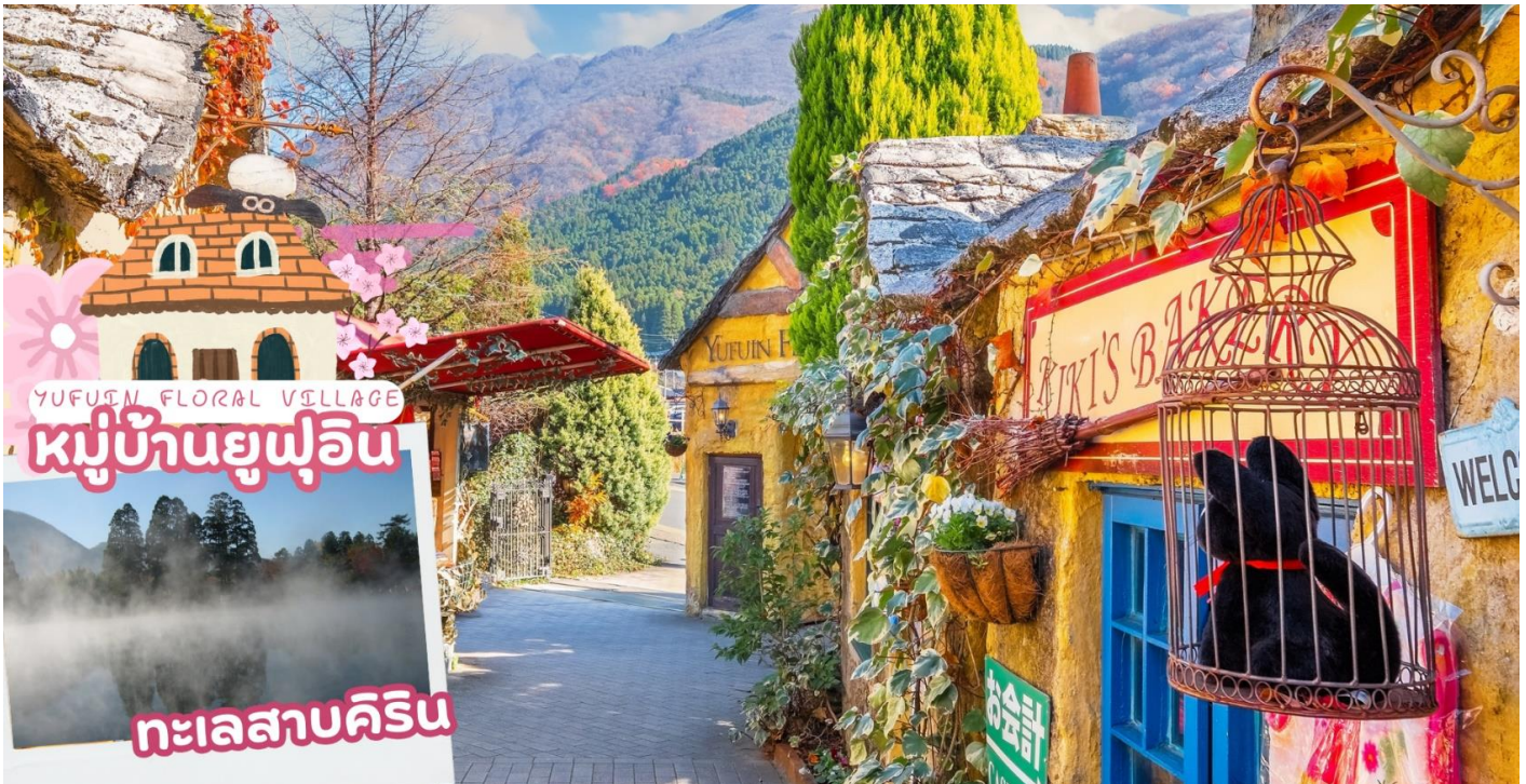
กลางวัน รับประทานอาหารกลางวัน ณ ร้านอาหาร (มื้อที่ 4)