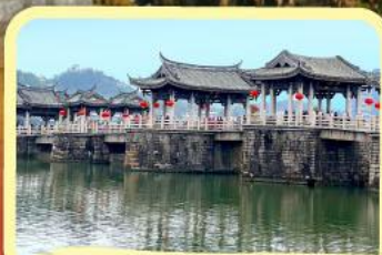
• สะพานโบราณกว้างจี้