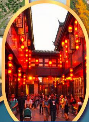
ถนนโบราณจิ้นหลี่