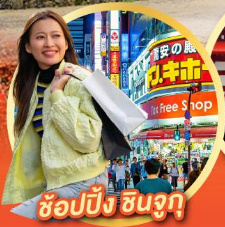
ช้อปปิ้ง ซินจูกุ

นั่งกระเช้าชมวิว ใบไม้เปลี่ยนสี Mt.Adatara