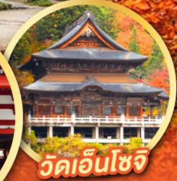
วัดเอ็นโซจิ

กิจกรรมเก็บผลไม้ พักออนเซ็น 2 คืน พักโรงแรมในโตเกียว 2 คืน