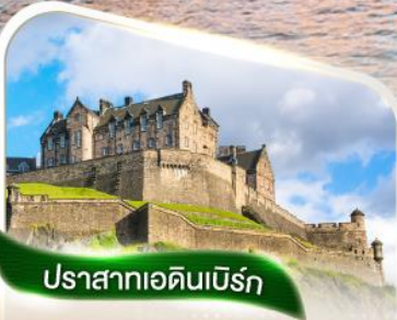
ปราสาทเอดินเบิร์ก