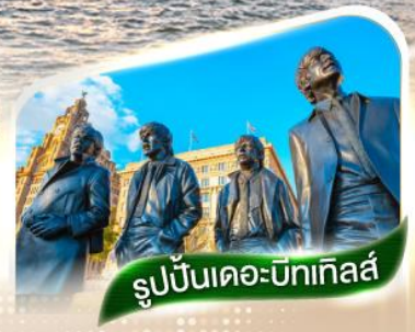
รูปปั้นเดอะบิกเทิลส์

★ตามรอยวงเดอะบิกเทิลส์และสโมสรรีเวอร์พูล★ ณ เมืองลิเวอร์พูล