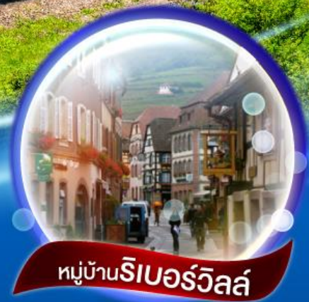
หมู่บ้านริเบอร์วิลล์