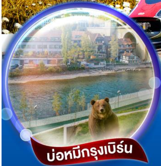
บ่อหมีกรุงเบิร์น