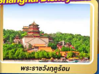
พระราชวังฤดูร้อน