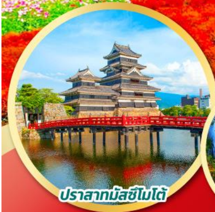
ปราสาทมัตสึชิมะ