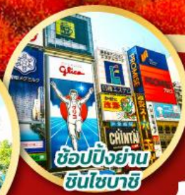
ช้อปปิ้งย่าน ชินโจบาชิ