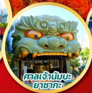
ศาลเจ้ามังกร ยาซากะ