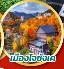
เมืองโจซังเค