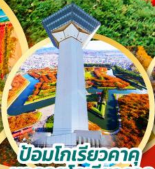
ป้อมโทริเอะคาคุ หอคอยโทริเอะคาคุ