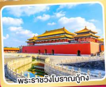
พระราชวังโบราณ