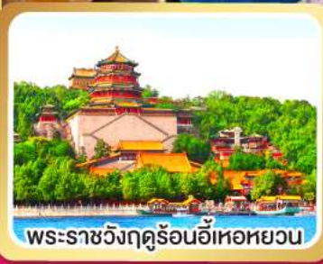
พระราชวังฤดูร้อนอี่เหอหยวน